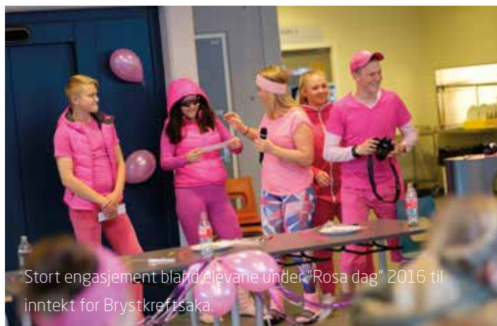
Stort engasjement blant elevane under "Rosa dag" 2016 til inntekt for Brystkreftsa.

EN AV SOGN OG FJORDANES STØRSTE RØRLEGGJERBEDRIFTER