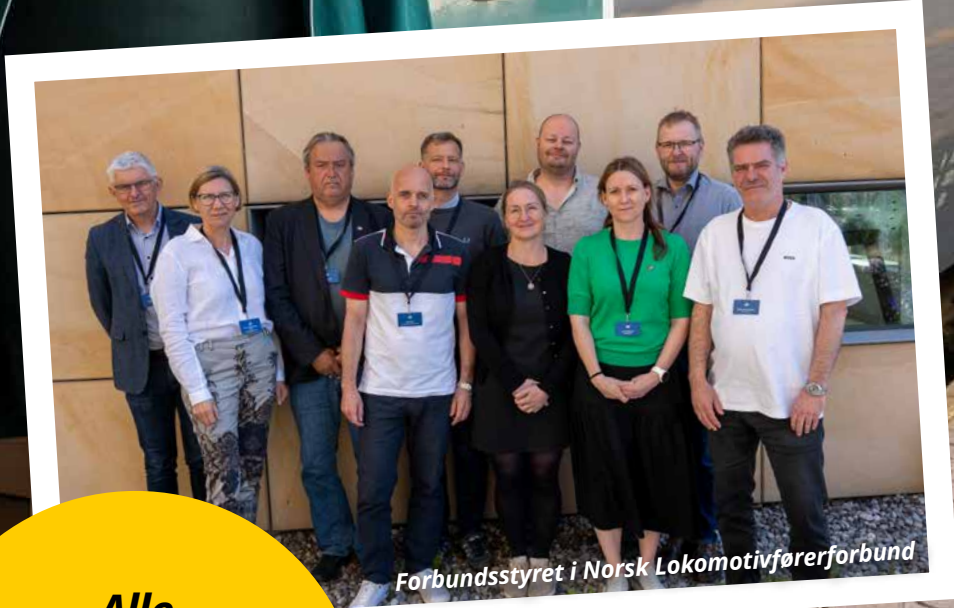
Forbundsstyret i Norsk Lokomotivførerforbund

Alle medlemmer teller – vi vil gjerne ha deg med på laget!