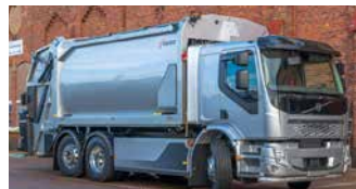
Norba N4 L200 og Volvo FE