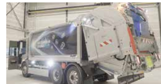
Geesink GPM IV og Mercedes eEonic