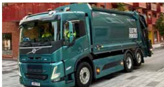
Norba N4 L200 og Volvo FM Electric

ENDELIG SÅ ER VÅRT 100% ELEKTRISK SØPPELBIL OGSÅ PÅ OEM-CHASSIS