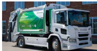
Norba N4 L200 Li-On Power og Scania EV