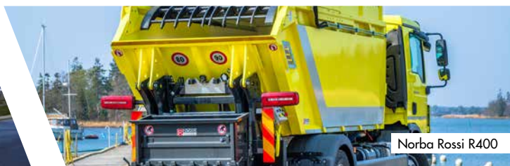
Norba Rossi R400