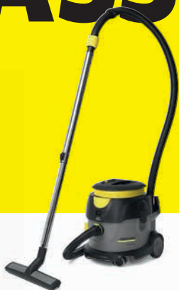
T 15/1 HEPA Støvsuger

Svært fleksibel og effektiv rengjøringsvogn som reduser den fysiske belastningen og leverer på alle behov.