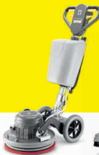
BDS 43/Orbital C Skuremaskin

Robust og batteridrevet teppe- og møbelrensers med 35 min driftstid pr. fylling. For ubegrenset, fleksibel rengjøring når du trenger det.