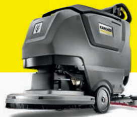
B 50 W Gulvvaskemaskin

Kraftig, robust og allsidig skuremaskin som gir maksimal rengjørings-effekt ved å kombinere orbitale og roterende bevegelser.