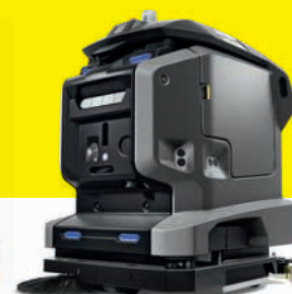
KIRA B 50 Gulvvaskerobot

Svært effektiv, robust og kompakt gulvvaskemaskin med drift. Leveres med doseringssystem som sparer både penger og ressurser.