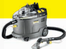
PUZZI 9/1 Teppemaskin

Stillegående og effektiv støvsuger med høy sugekraft kombinert med ergonomisk komfort og høy arbeidsradius.